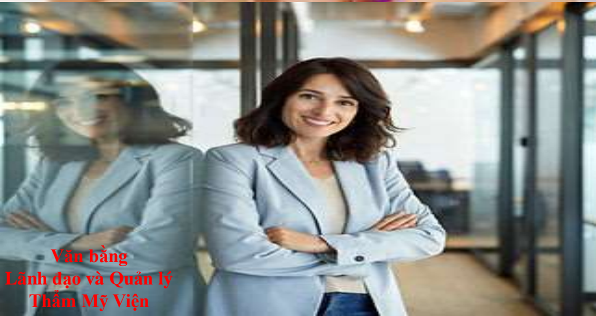
Văn bằng Lãnh đạo và Quản lý Thẩm Mỹ Viện