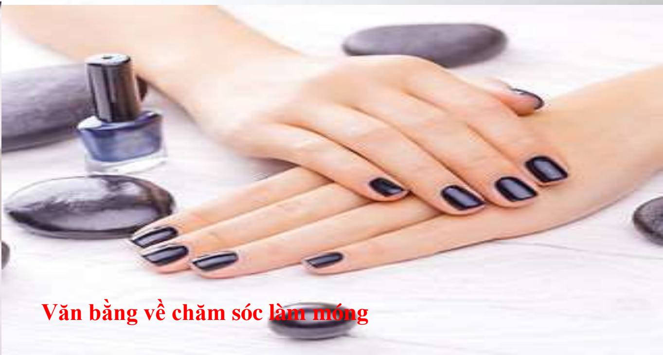
Văn bản về chăm sóc làm móng