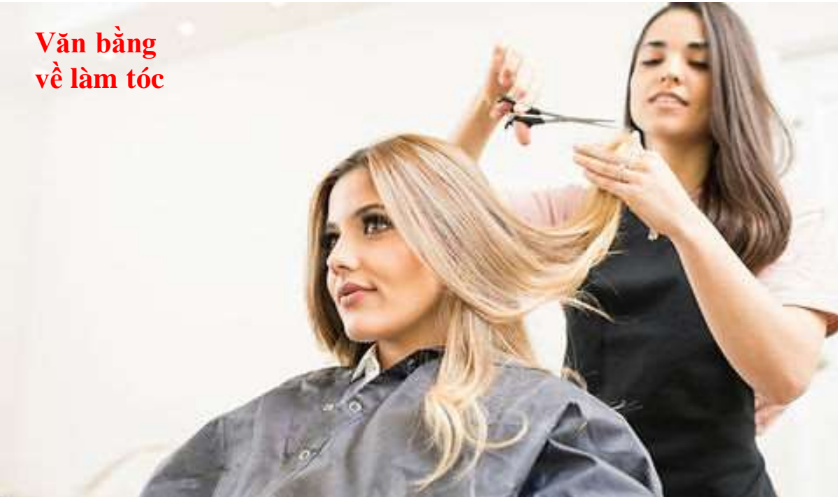
Văn bản về làm tóc