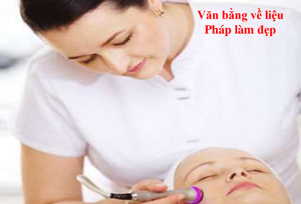
Văn bằng về liệu Pháp làm đẹp