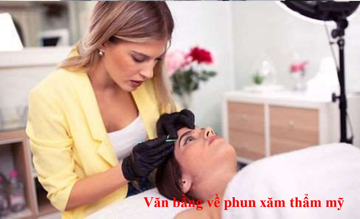
Văn bản về phun xăm thẩm mỹ