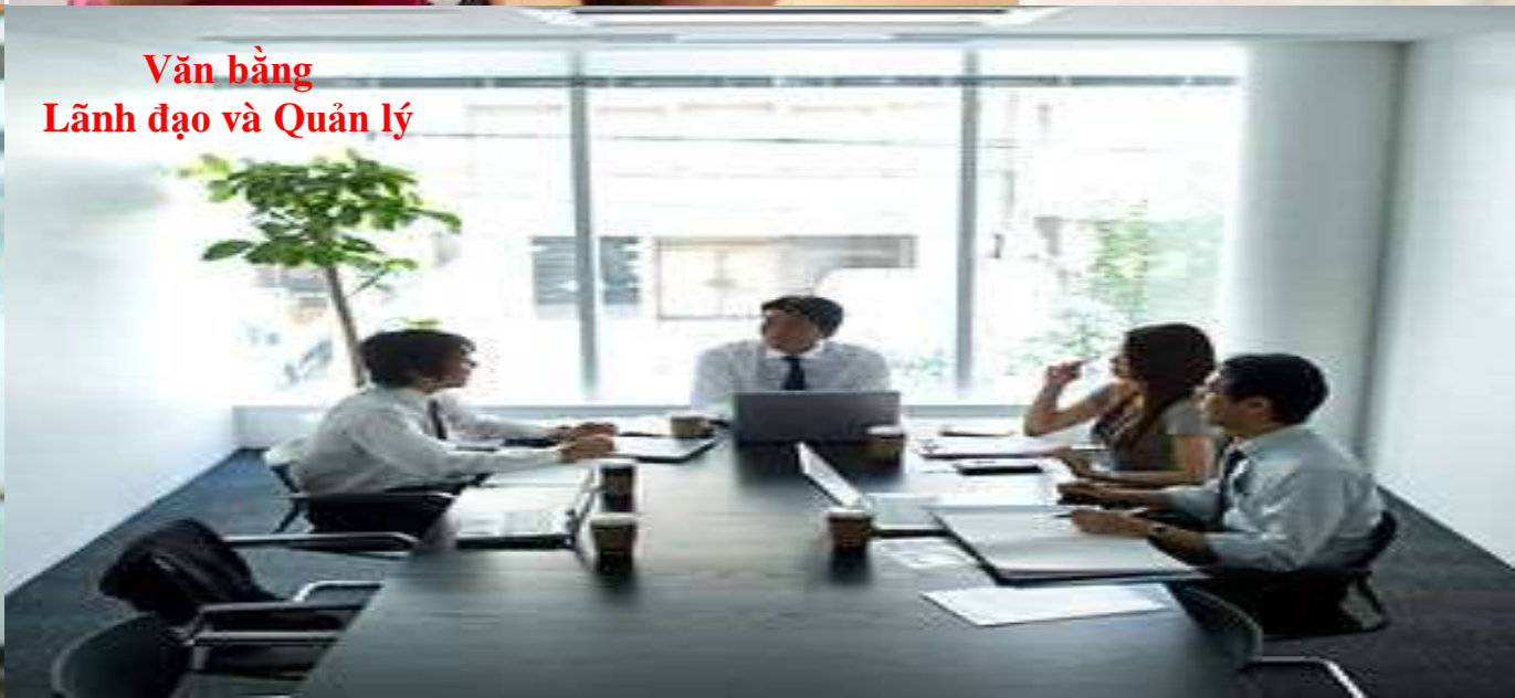
Văn bằng Lãnh đạo và Quản lý